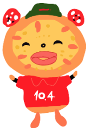
10.4 公式ゆるキャラ とっしー

成果に応じて支給される「業績給」やキャリアアップにもつながる資格制度があります。各店舗で売上を上げるため、生産性を高めるために、何をやるか、自分たちのできる範囲で実施して頂きます。お店のスタッフさんと一丸となって、チーム「テン.フォー新ひだか店」として仕事をして頂ける方を求めています。