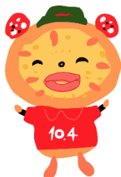
10.4 公式ゆるキャラ とっしー

成果に応じて支給される「業績給」やキャリアアップにもつながる資格制度があります。各店舗で売上を上げるため、生産性を高めるために、何をやるか、自分たちのできる範囲で実施して頂きます。お店のスタッフさんと一丸となって、チーム「テン.フォー新ひだか店」として仕事をして頂ける方を求めています。