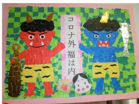
4 入居者の方が貼り絵を作成しました。