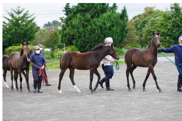
「ひだかうまキッズ探検隊」受け入れの様子